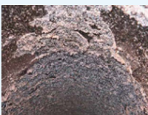
Rohrschnitt vor Anwendung KS

* die Zusammenfassung in deutscher Sprache senden wir Ihnen auf Wunsch gerne zu