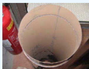
Nach einer weiteren Befuerung